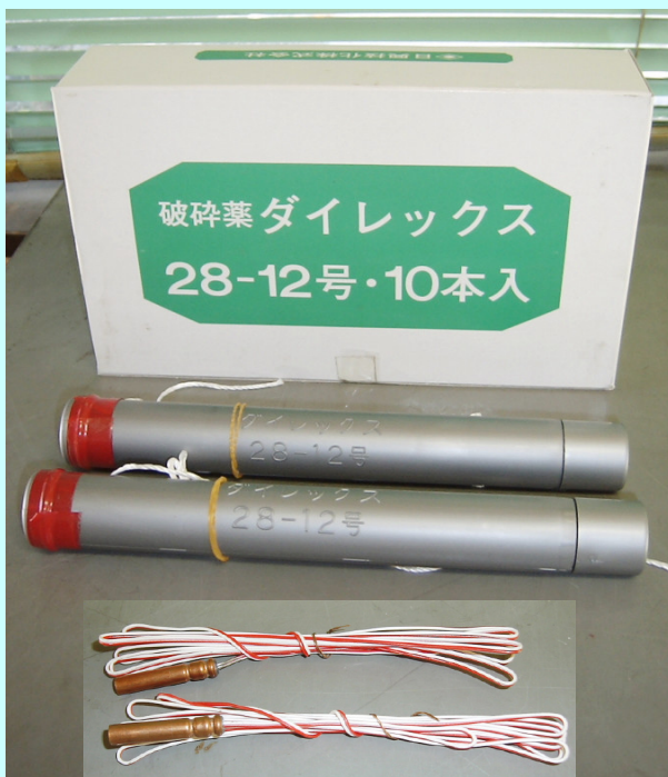
非火薬 破砕薬ダイレックス28-12号の薬筒と着火具